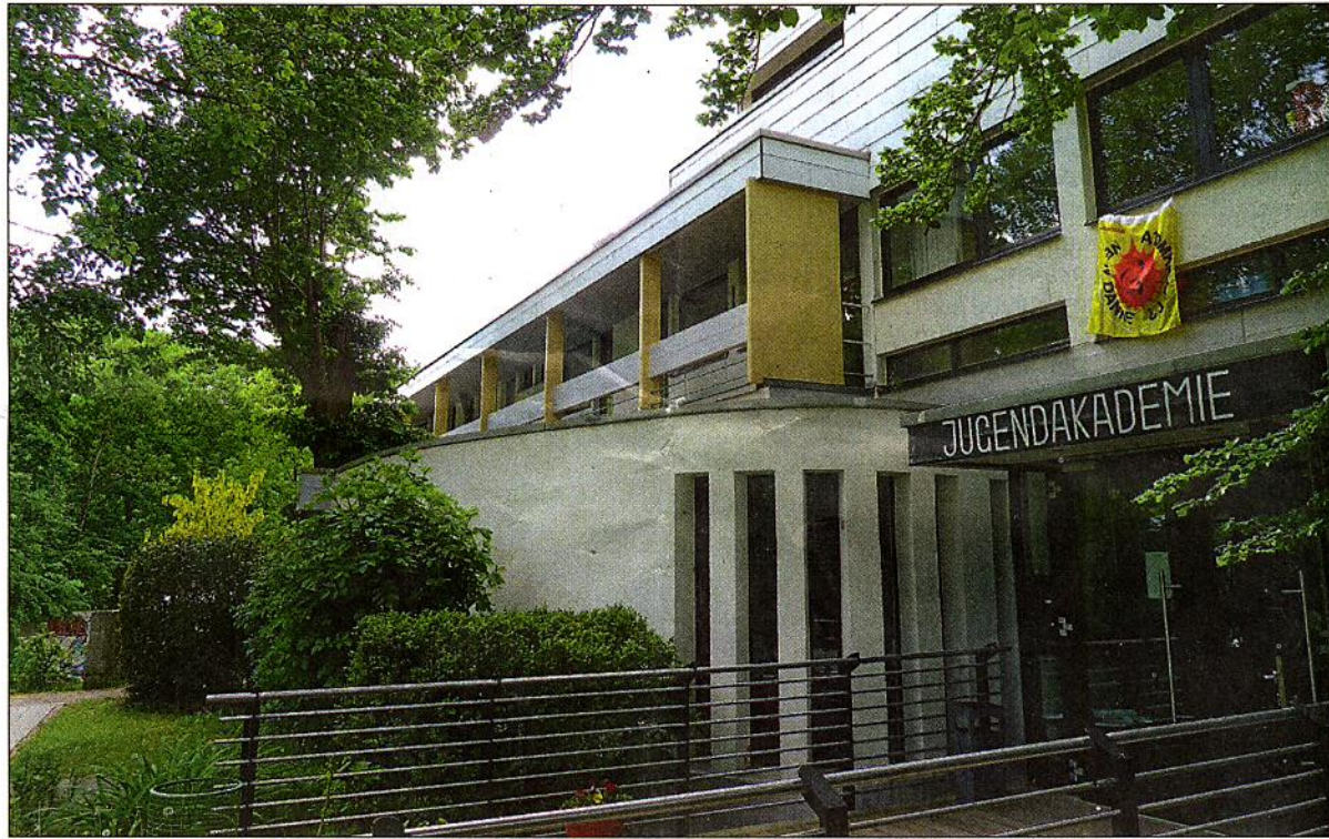
Blick auf die Jugendakademie, deren Anfänge auf das Jahr 1964 zurückgehen.