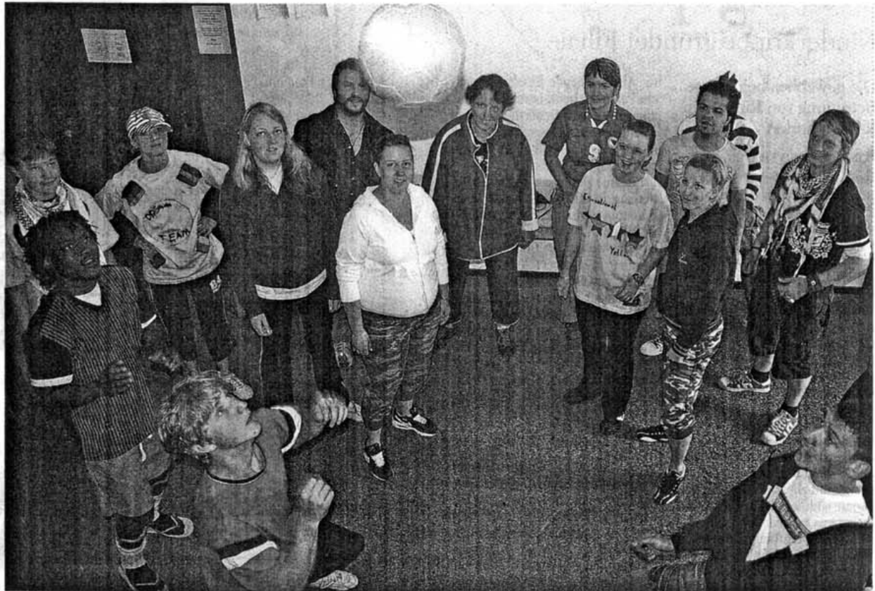
Ihre Kick-Künste zeigen Mitglieder der deutschen Gruppe beim Fußballcamp in der Jugendakademie Walberberg.