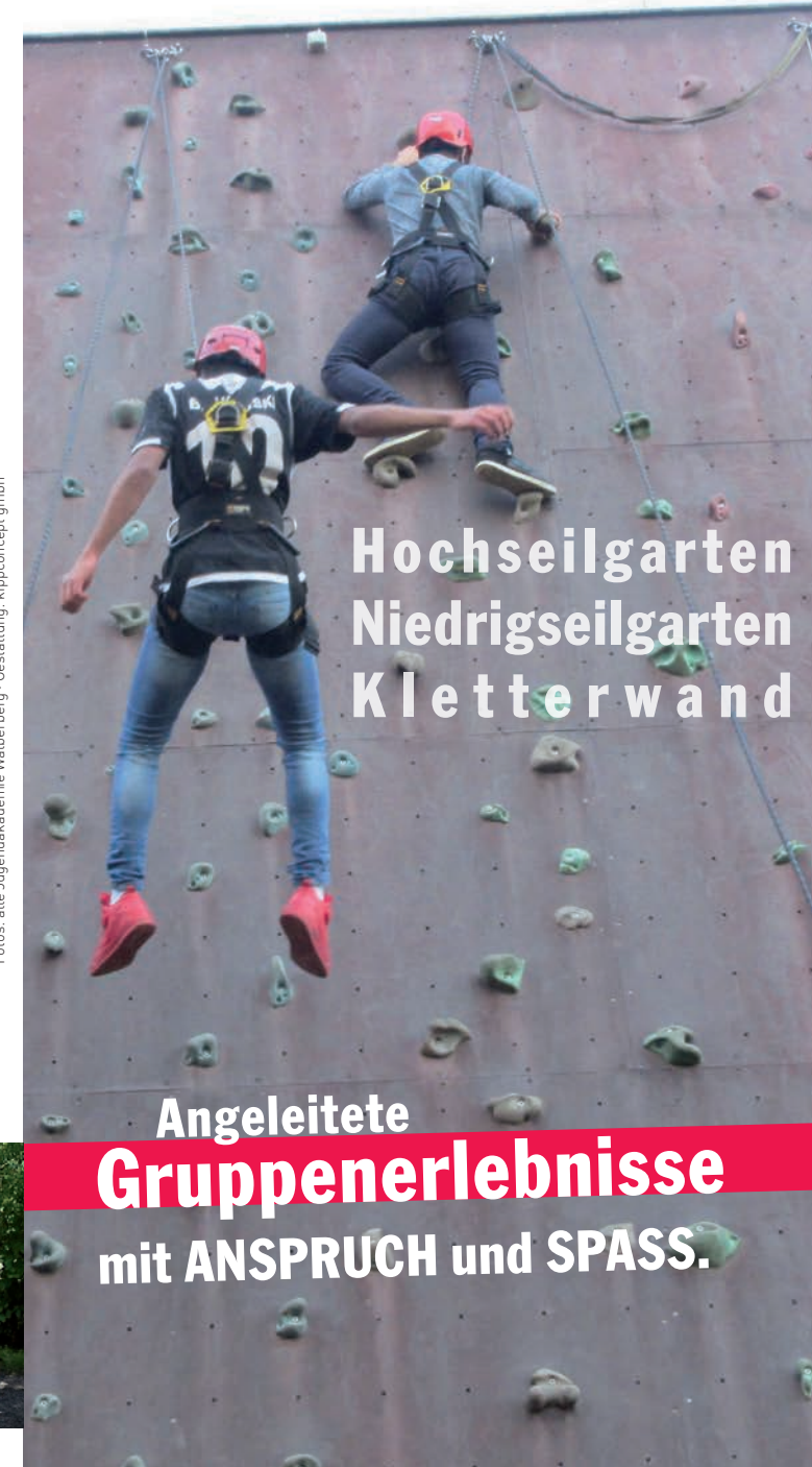
Gestaltung: kipponconcept gmbh

Hochseilgarten Niedrigseilgarten Kletterwand